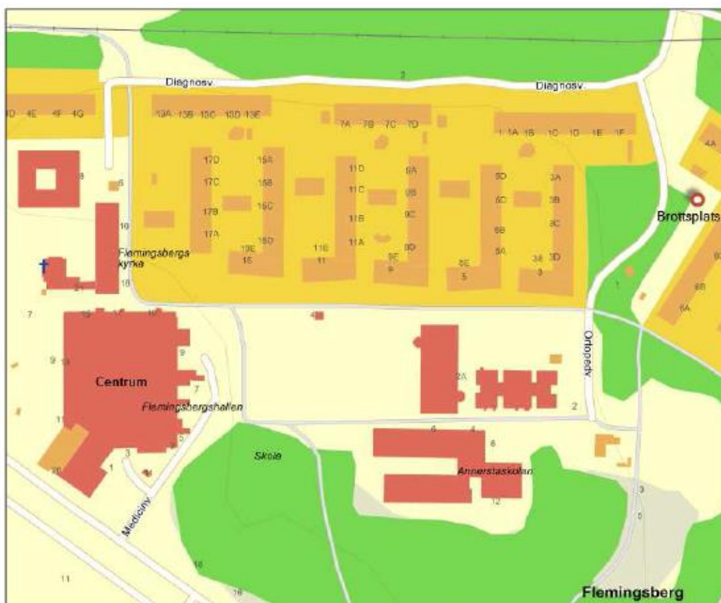
Karta visande centrumets position och närhet till brottsplatsen.

För läsförståelsens skull redovisas följande kartor.